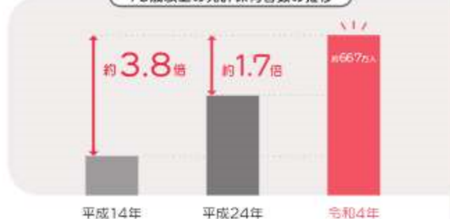
75歳以上の免許保有者数の推移