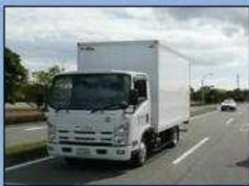
まうし きんきゆうしやりよう せつきんちゆう 真後ろから緊急車両が接近中