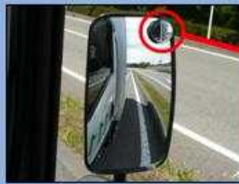
サイドミラーでは緊急車両 を確認できない。