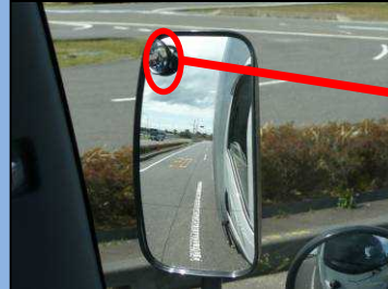
サイドミラーでは自動二輪車 を確認できない。