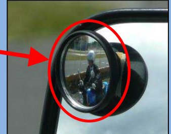
補助ミラーでは死角にいる 自動二輪車を確認できる。