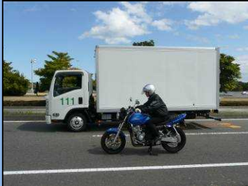
サイドミラーの死角にいる 自動二輪車