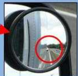
補助ミラーでは真後ろの 緊急車両を確認できる。