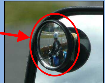
ほじょ しかく 補助ミラーでは死角にいる 自動二輪車を確認できる。