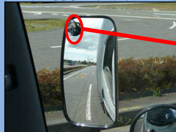
じどうにりんしゃ サイドミラーでは自動二輪車 を確認できない。