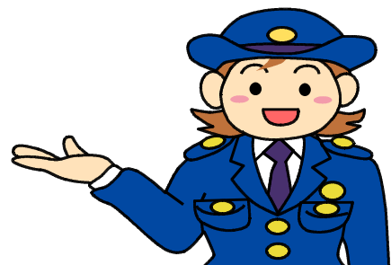
【キャンペーンの実施状況】