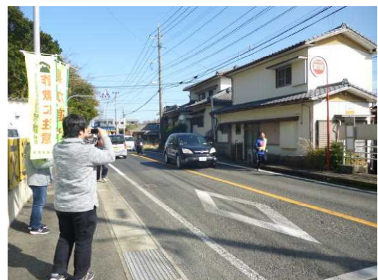
松浦警察署前を力走する選手

結果は、さておき、沿道からの声援 交通整理中の同僚の姿を励みに「襷」をつなぎました。 初出場した署員は、市民の駅伝熱と大会のレベルの高さを、改めて感じたようでした。