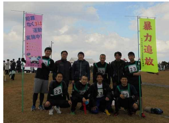
さわやかな表情の出場選手