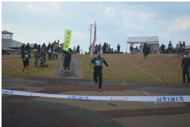
ラストラン?ゴールの場面

夫人や子供の声援に、頼もしい父親の姿を見せようと最後の急な階段も必死で駆け上り、心地よい達成感を味わいました。