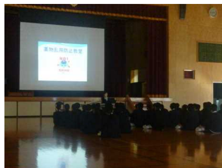
御厨中学校での講話

当署でも、スクールサポーター等とともに、『薬物の怖さ』を教える講話を行っています。