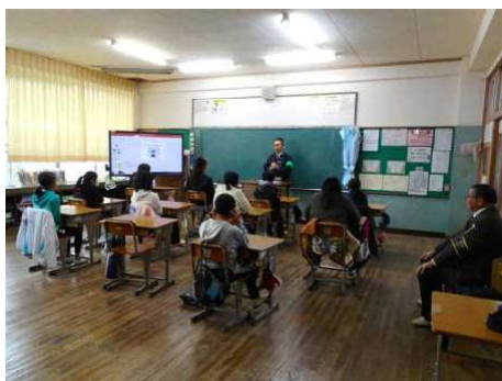
鷹島小学校での講話