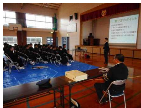
鷹島中学校での講話