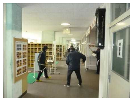
御厨中学校での訓練