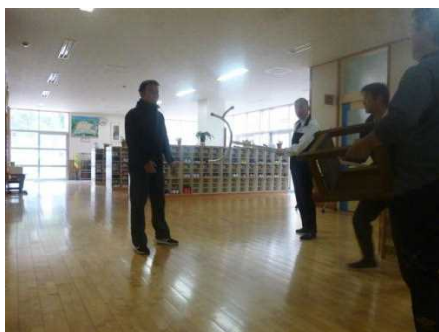
御厨小学校での訓練