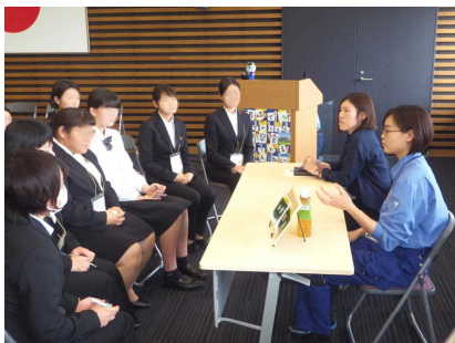
【女性限定就職説明会】