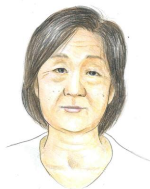
生前のイメージ図 (入院当初の60歳頃)